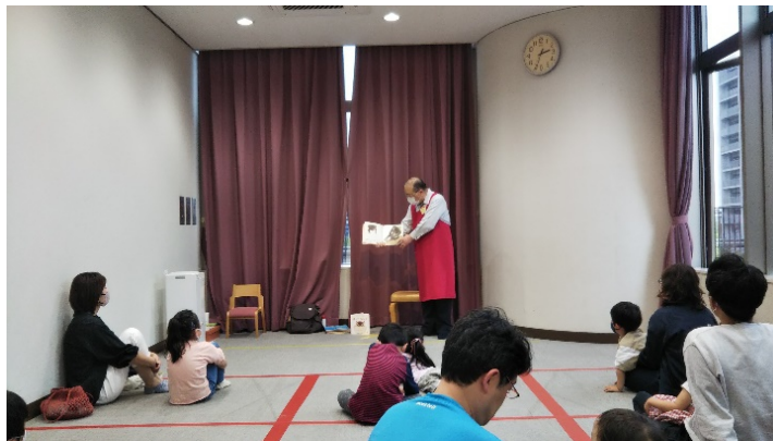
読み聞かせの様子

【読み聞かせ(ミラトン)】 場所ミラトンおやこルーム 第4火曜 11:00~11:30