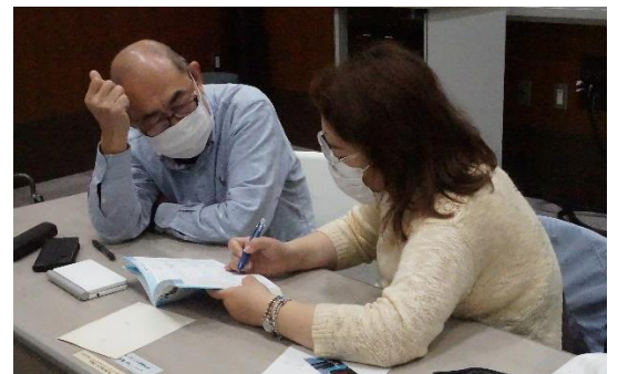
基本はマンツーマン学習