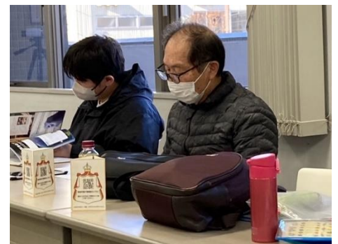
学校の宿題のお手伝いをするボランティアの皆さん