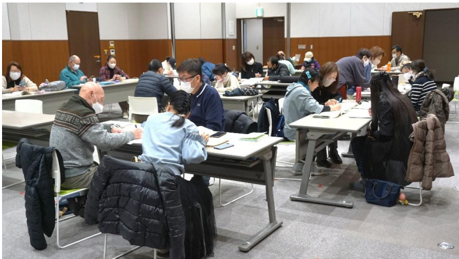
草加市立中央図書館多目的ホールで学習

日本は少子高齢化が今後ますます進み、社会を維持していくためには外国人労働者を増やしていかざるを得ない状況になりつつあります。このような社会的背景のもとで、日本で生活する外国人は増加傾向にあり、この草加市周辺も例外ではありません。私たち「にほんごひろば」は公共図書館のボランティア団体の活動の一部として、地域に住む外国出身者を対象として日本語教室を開催・運営しています。外国人学習者の皆さんが一日でも早く日本の社会に溶け込めるようになるよう、活動を推進してまいります。