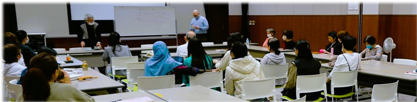
「外国の文化を知ろう！」ドイツ編