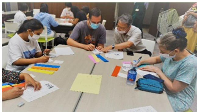
短冊を書く学習者の皆さん

学習を通じて国際交流の楽しさや、地域貢献を実感できる、素晴らしいボランティア活動です!! ぜひ入部し体験してください。 問い合わせ にほんごひろば 古沢 電話 090-9644-5764