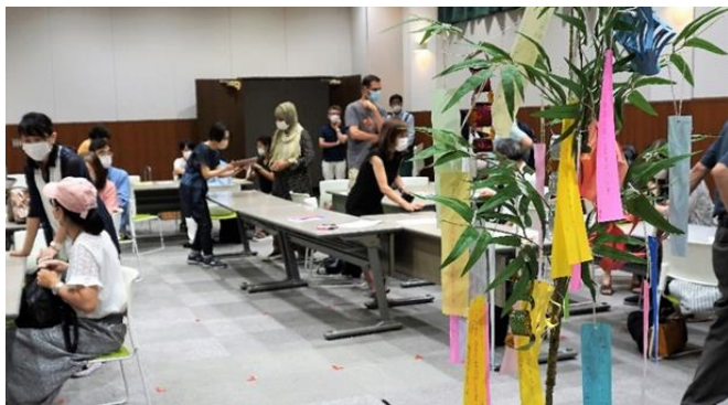
昨年7月の七夕まつりの風景